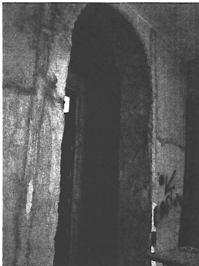
HOTEL PATRIA - VANO DA MURARE AL 1° PIANO