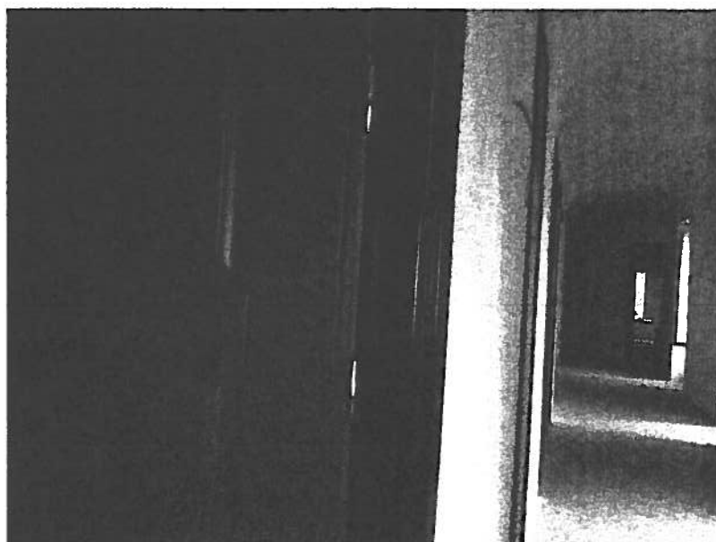
HOTEL PATRIA - CORRIDOIO 1° PIANO